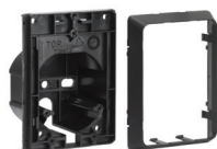
Adapter do montażu podtynkowego lub w kolumnie*