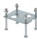
Podstawa montażowa do kolumny aluminiowej